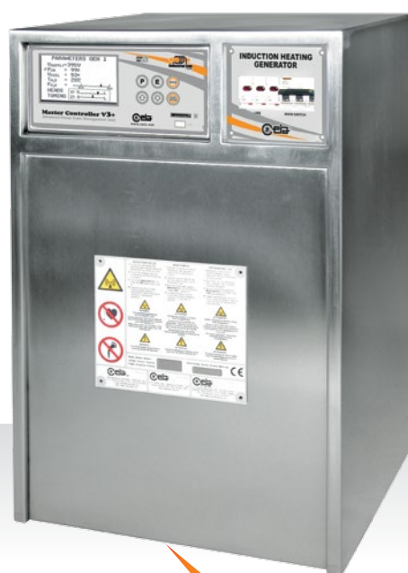
POWER CUBE 360/50