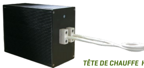
TÊTE DE CHAUFFE HH13 pour Power Cube 90/50 et 180/50

Le recours à des solutions techniques innovatrices et à des composants de dernière génération font des générateurs de la série 50 des appareils très performants en termes de fonctionnement, de puissance fournie et de coûts d'exploitation.