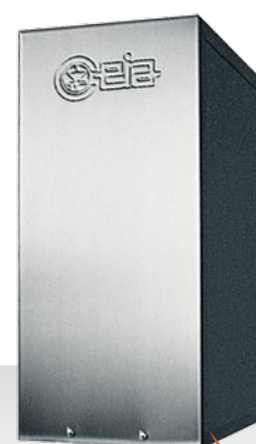
POWER CUBE 90/50 POWER CUBE 180/50