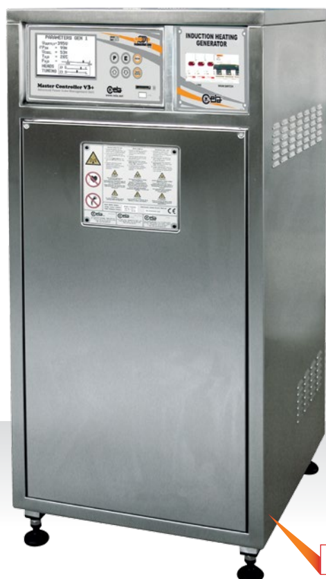
POWER CUBE 720/50